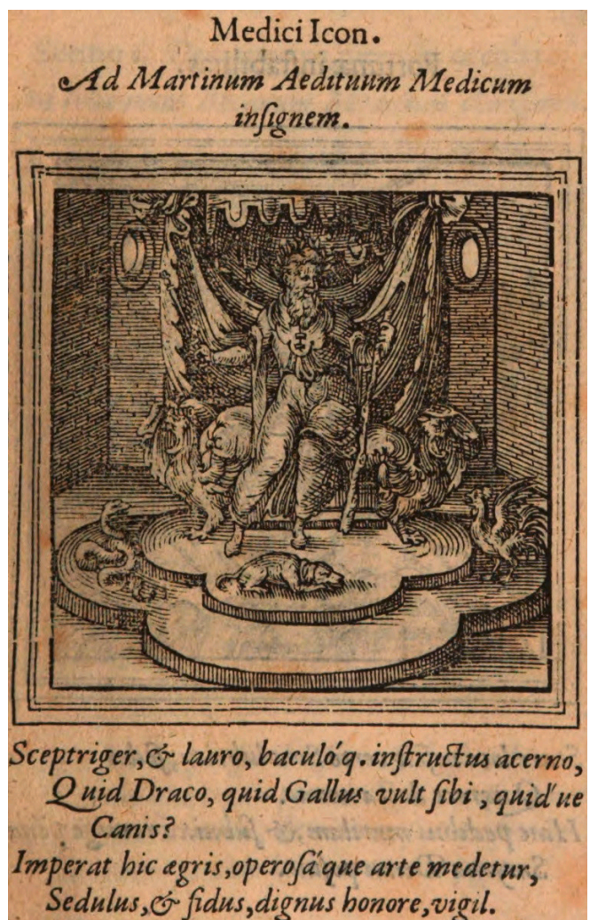
Abb. 1 Hadrianus Junius, Medici Icon (1565), S. 31

Herrschenden beziehungsweise Triumphators über die Krankheit, den Stab als Zeichen des Heilers, den Hund als Symbol für Gewissenhaftigkeit und Zuverlässigkeit sowie Schlange und Hahn als Symbole der Wachsamkeit. Bild und Text rücken den Arzt in die Sphäre eines Herrschers, dessen sorgsames