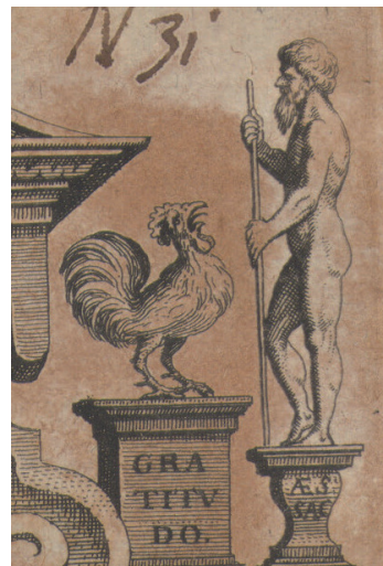
Abb. 3 Fabry, Wilhelm: Observationum & Curationum Chirurgicarum Centuria V . Frankfurt 1627, Kupfertitel, Ausschnitt