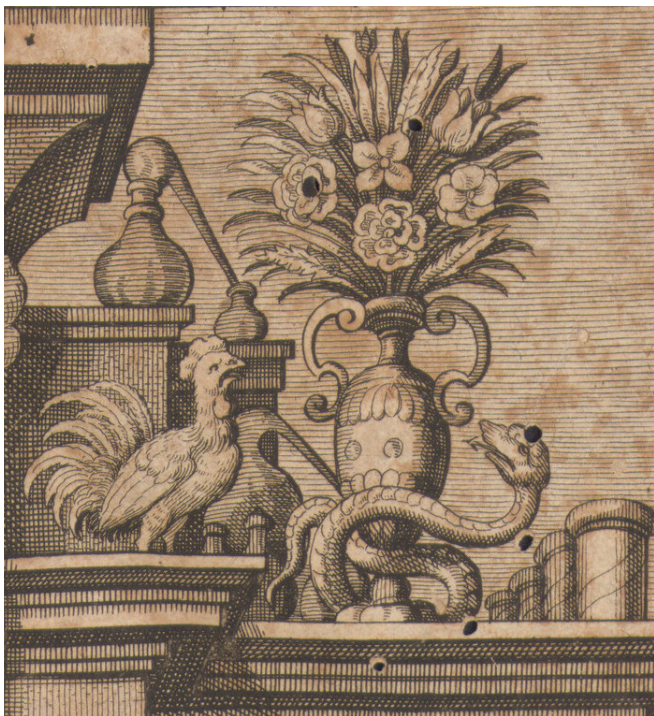
Abb. 5 Wilhelm: Opera Observationum et Curationum Medico-Chirurgicarum Quae Extant omnia . Frankfurt 1646, Kupfertitel, Ausschnitt

fünftens Centurie Zeichnungen und Instrumente aus diesen 100 Fallberichten entnahm, scheint sich Furck auf Fabrys programmatisches Vorwort konzentriert zu haben (Widmung und Vorwort an den Leser). So vereinte er allgemein geläufige medizinisch-chirurgische Darstellungen mit spezifischen Motiven, die auf Fabrys Text rekurrieren (Abb. 4). 26