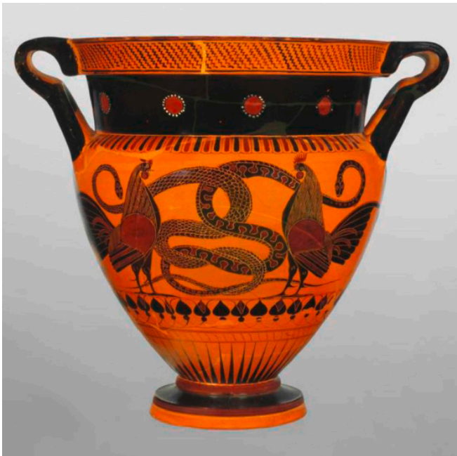
Abb. 1 Antithetisch angeordnete Hähne mit Schlangen. Vasenbild des Inschriften-Malers, chalkidischer schwarzfiguriger Krater, ca. 540 v. Chr.

schuldig, Kriton [...]“ in einer Weise, die volles Verstehen des Zusammenhanges suggeriert: ἀλλὰ ταῦτα, ἔφη, ἔσται, ὁ Κρίτων· ἀλλ’ ὄρα εἴ τι ἄλλο λέγεις, Phaid. 118 a 9–10, „das soll [zu deiner Zufriedenheit] geschehen [Sokrates, natürlich]!, so antwortete Kriton. Doch jetzt sieh zu, was du noch sagen willst“, so antwortet er dem Sterbenden. Er fragt nicht nach, um welche Sache es denn gehe, oder signalisiert Unverständnis. Nein, er versichert dem Freund, dessen Wunsch gern zu erfüllen. Da nichts problematisiert wird an dieser Stelle, geht der Rezipient von einem vorausgegangenen Ereignis aus, das keinen Eingang in Phaidons Bericht gefunden hat.